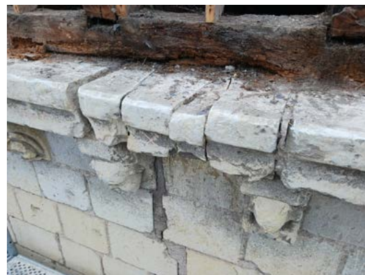
Maître d'ouvrage : Mairie de Bourgueil Maîtrise d'oeuvre : ARCHI TRAV – François JEANNEAU – Architecte en Chef des Monuments Historiques